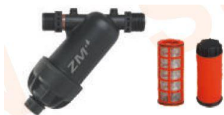
ZM6002(1" screen) ZM6004(1" disc)