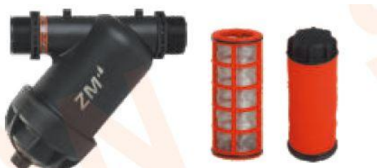
ZM6009(1 1/2" screen super) ZM6010(1 1/2" disc super)