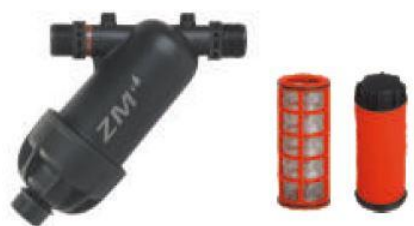
ZM6001(3/4" screen) ZM6003(3/4" disc)