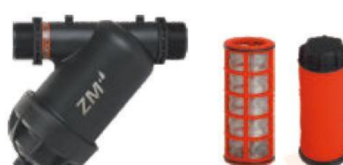
ZM6011(2" screen) ZM6012(2" disc)